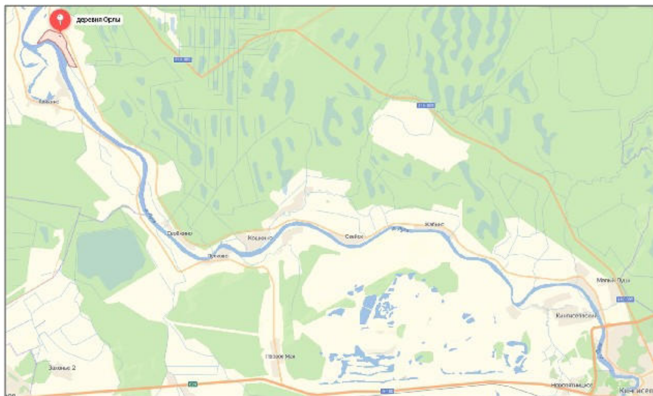
Рисунок 1.2 – Расположение д. Орлы